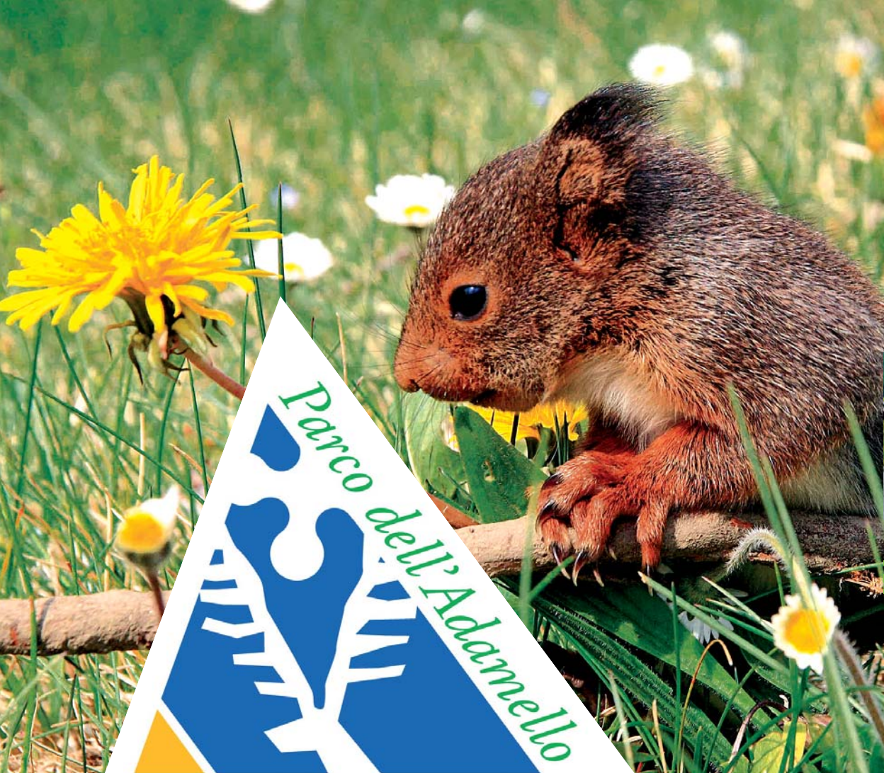
TIPOGRAFIA CAMUNA SPA BRENO-BRESCIA